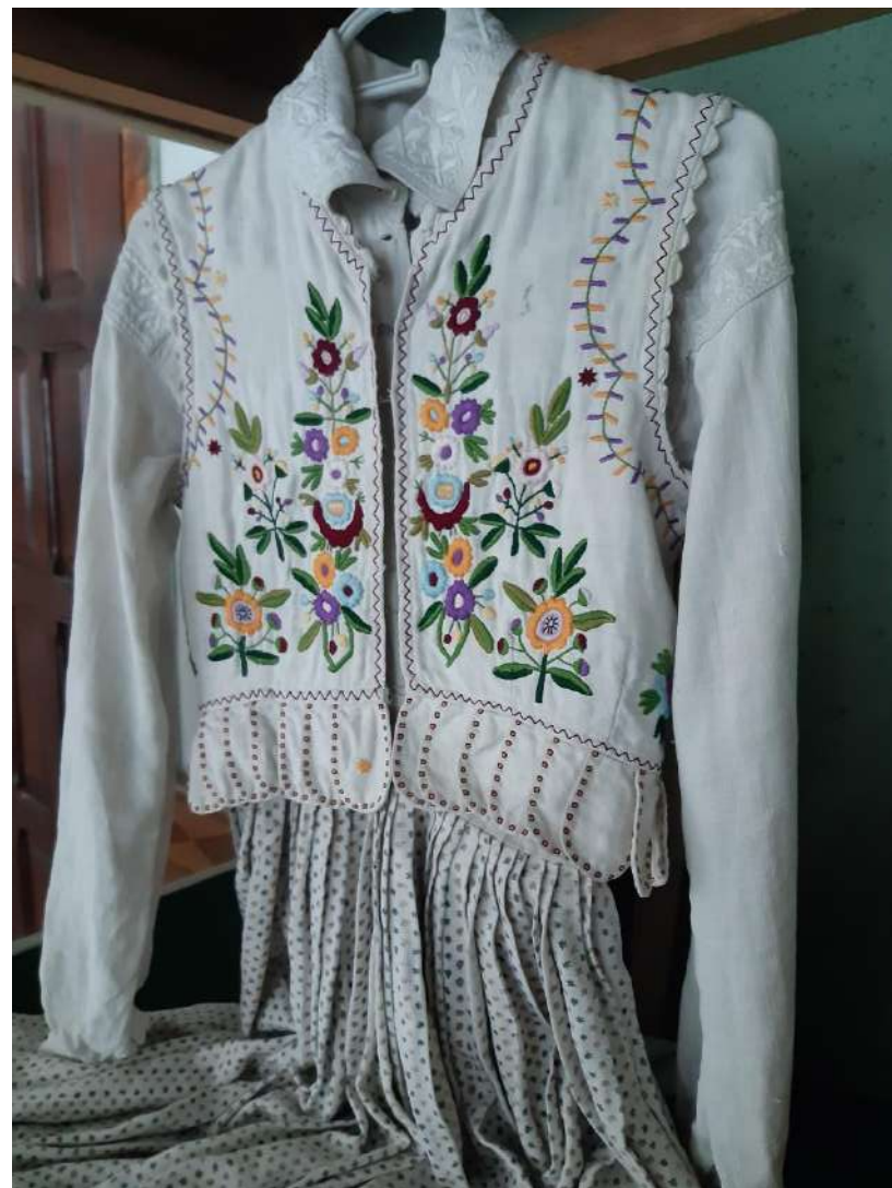
Жіноче весільне вбрання